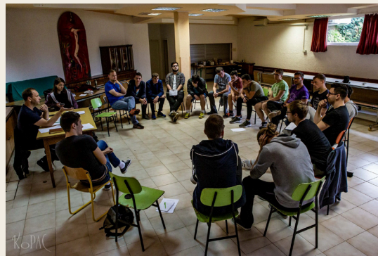
Spoznavni vikend za študente študentske rezidence

V Cerkvi na Slovenskem, kot tudi drugod, imamo ljudi različne potrebe glede na starost, status, interes. Zagotovo je, da nimajo vsi popolnoma enakih potreb, temveč, da obstajajo določene specifikke. Že med mladimi samimi opazimo različne potrebe, glede na starost ali interese. Nekaj podobnega je z drugimi starostnimi skupinami. To pa ne pomeni, da delo z različnimi starostnimi skupinami pomeni razdeljevanje skupnosti, pač pa le upoštevati specifikko ali posebnosti vsake. V Kolegiju v Ljubljani skušamo mladim nuditi čim boljše vsebine in pogoje za osebno in duhovno rast, ki je značilna za to obdobje. Izkaže se, da so potrebe dokaj velike. Glavni izziv je, kako nanje ustrezno odgovoriti. Delo z mladimi je zaznamovano z medgeneracijskim učenjem, kjer potrebujemo drug drugega. Jezuitski kolegij ima v okviru svoje ponudbe za mlade med drugim tudi študentsko rezidenco. Nekaj naših študentov torej stanuje tu pri nas, večina pa prihaja k nam iz mesta. S študenti ki živijo pri nas, je mogoče in potrebno delati na nekoliko bolj intenziven način. Ta vključuje, poleg akademsko intelektualnega življenja, še učenje življenja v skupnosti, soodgovornosti ter iskanje osebnega in skupnega poslanstva.