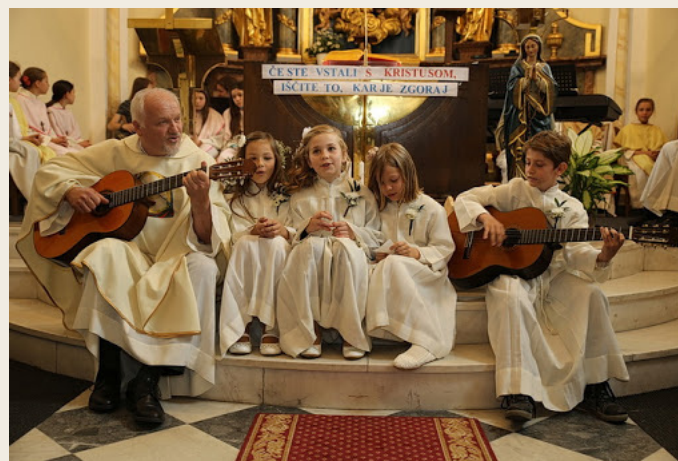
Razvijanje glasbenih darov in sodelovanje otrok pri liturgiji

Sedaj v župniji v Radljah ob Dravi v precejšnji meri pogrešam tovrstno delo. Otrok imamo veliko in bi lahko z njimi ustvarjal dramske predstave. A tako kot pred tem, ko sem bil dve leti v Dravljah kot tudi sedaj tukaj, se sprašujem: za koga naj pripravljamo predstave? Starejše v cerkvi zanima le maša, ko pa povabiš k predstavi mlajše generacije, pa pridejo na predstavo le svojci nastopajočih. V Ljubljani v Dravljah smo zajeli množico z dramsko skupino in ostalimi le ob miklavževanju, ob polnočnici in ko smo na Cvetno nedeljo pripravili Jezusov pasijon. Torej, lepo je, če z igro lahko nagovoriš ali razveseliš več ljudi. Sicer pa imam, kljub vsemu, tukaj v župniji na skrbi dramske uprizoritve oratorijske zgodbe v času Oratorija.