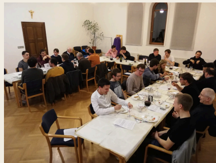
Večerja študentov z jezuitsko skupnostjo

tudi dobra hrana. Veliko je smeha in glasbe in - se sme to povedati? - vina. Posledično si v hiši nihče ni tujec, zato je vzdušje toliko bolj toplo in prijazno.