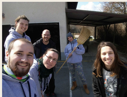
p. Egon z mladimi

zanje, da rastejo v samozavesti, kot tudi za njihove starše ter župljane ki prisostvujejo maši. Če jih resnično poznaš in jim lahko zaupaš, je to nekaj čudovitega, saj verjameš vanje. Preko zaupanja odgovorne naloge postajajo samozavestni, odgovorni, vedno bolj odrasli, hkrati pa se učijo tudi zaupanja drugim.