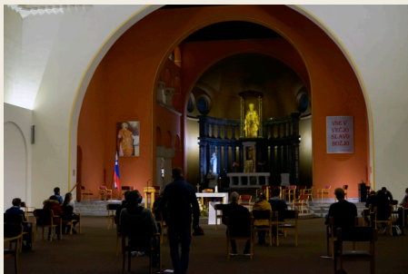
Četrtkove sv. maše

suho zlato. Čeprav je Cerkev kot občestvo nezmotljiva, posamezniki znotraj nje nismo; in tega se je treba zavedati.