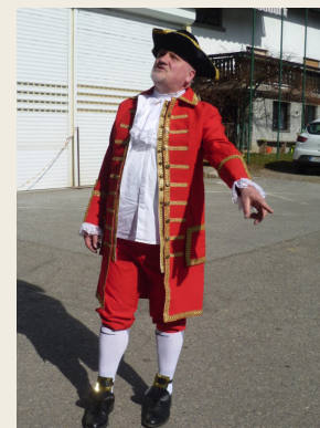
Preizkus baročnega kostuma

spomnim posebej božične igre o nastanku pesmi Sveta noč, ko sem bil povabljen, da odigram vlogo Jožefa Mora, ki je napisal besedilo za to pesem. Kako sem se vživel v to vlogo. Še mene je ganilo. Rad sem pripravljaval miklavževanja, postavljaj jaslice, kasneje kot kaplan pa ustvarjal na različne načine skupaj z otroki in mladimi. Koliko predstav smo odigrali. Še posebej moje kaplansko obdobje v župniji sv. Magdalene je bilo v šestih letih zapolnjeno z nenehnim ustvarjanjem. Otroci in mladi radi nastopajo v dramskih igrah. Vedno so se našli izraziti talenti. Ob pripravi dramskega besedila sem pripravljaj kostume, kulise itd.