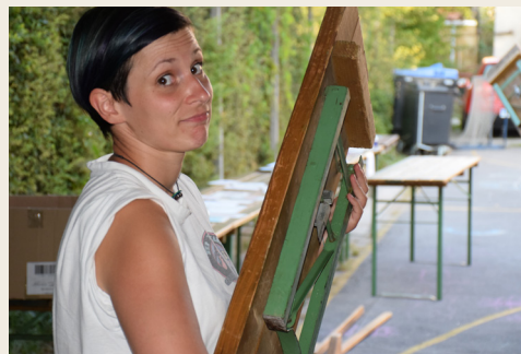
Osebni zgled je najboljše učenje

Kot voditeljica animatorjev želim pri mladih vzpodbuditi željo do dela za druge, da bi ta dela dobrote opravljali z veseljem, da bi jim bila dobrotljivost in zaupanje v Boga na prvem mestu. Želim si, da bi videli Božjo ljubezen pri delu za druge; kako ti ta napolni srce. Želim si, da bi videli Boga kot prijatelja, največjega zaupnika in Očeta. Tako bodo lahko to, kar vidijo in čutijo od mene, nesli v svet in bili zgled Božje ljubezni, kamorkoli jih bo življenje odneslo. Kot katehistinja pa želim otrokom približati vero, jo pokazati v taki luči, da bo razumljiva in dostopna, pokazati jim želim, kako nam zaupanje v Boga lahko pomaga skozi vse naše življenje in kako božja ljubezen deluje preko nas, ko pomagamo drugim. Glede na reklo »na mladih svet stoji«, se spodobi, da jim že v mladih letih pomagamo začutiti Božjo ljubezen.