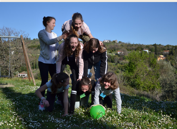
Povezanost in sodelovanje v skupini