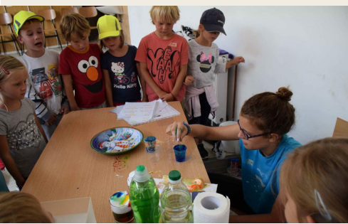
Teja z otroki

Ob vključitvi v skupino animatorjev sem začutila njihovo močno povezanost ter željo za doseganje skupnih ciljev. Po nekaj dogodkih, ki smo jih pripravili s skupnimi močmi, sem se z njimi povezala tudi jaz, kar je mojemu sodelovanju v župniji prineslo še dodatno veselje. Mladi, sploh v obdobju najstništva, to potrebujemo. Potrebujemo občutek pripadnosti in sprejetosti v skupini naših vrstnikov, potrebujemo nekoga, ki razmišlja podobno kot razmišljamo mi. Vse to in še več je meni takrat nudilo animatorstvo. Prijateljske vezi, želja po novih izkušnjah in delitvi ter dograjevanju mojih talentov pa so me spodbudili še k temu, da sem se nato priključila še nekaterim ostalim skupinam in ob tem vedno bolj izoblikovala in dograjevala tudi svoj osebni odnos do vere, ki sem ga do takrat malce zapostavljala.